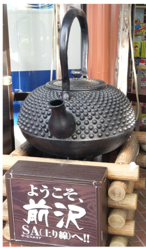
前沢SA(上り線)の入り口で大きな南部鉄器を発見 (岩手県連 書記局より投稿)

教宣部からのコメント 南部鉄器は盛岡と水沢が生産地。その昔、盛岡は南部藩。水沢・前沢は伊達藩。この鉄びんは、南部藩と伊達藩の境塚に見えるが、下り線にもあるのかな