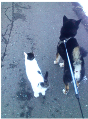
犬の散歩をする時はいつも猫も一緒でとても仲良しです。リク君(犬)とチャック君(猫) (江刺建築組合 事務局より投稿)

教宣部からのコメント リク君・チャック君は尾を上げ、左右を見て何を目当てかな・・・