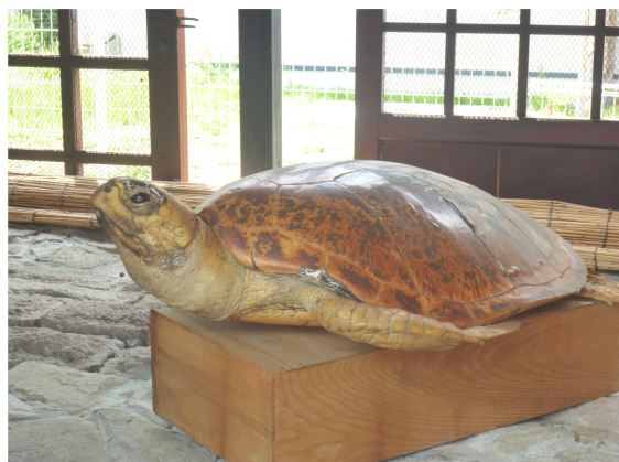
秋田県の角館に行った時、お店の敷地内にウミガメのはく製がありました。今にも動き出しそうでした。(県連書記局より投稿)

とある神社におみくじの順番があり撮影。長い間、間違っていたことに気がきました。これで初詣はバッチリです。(県連書記局より投稿)