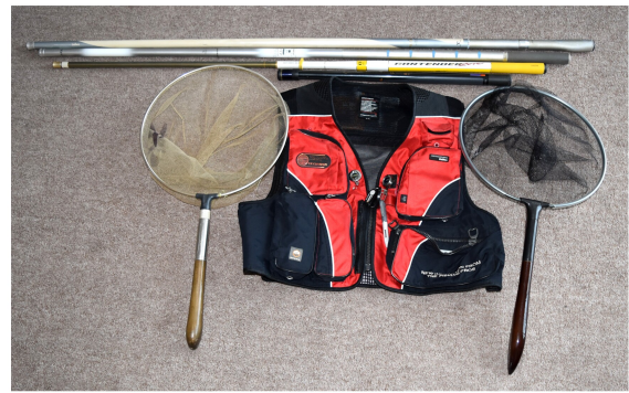
自慢の釣り具。とくにご覧あれ

自分自身のこだわりについて余り考えたことがなかった。そこで女房に聞いてみた。すると一言「何にかに付けてもこだわっているじゃない」と言われた。 そこで今回は、過去の趣味を書こうとします。30代から50代前半まで、溪流釣りが趣味でした。竿、ベスト、キャップ、偏光メガネ、ウエイダー、タモ、魚籠をとあるメーカーで統一していました。 また、2年ごとに新製品が出ると、カタログを広げてもの欲しそうに眺めていたそうです。 ヤマメ釣りが好きで、岩手県共通入漁証、雫石川入漁証を毎年買い、北は米代川支流片川、南は、砂鉄川、沿岸部は、気仙川、閉伊川支流小国川に